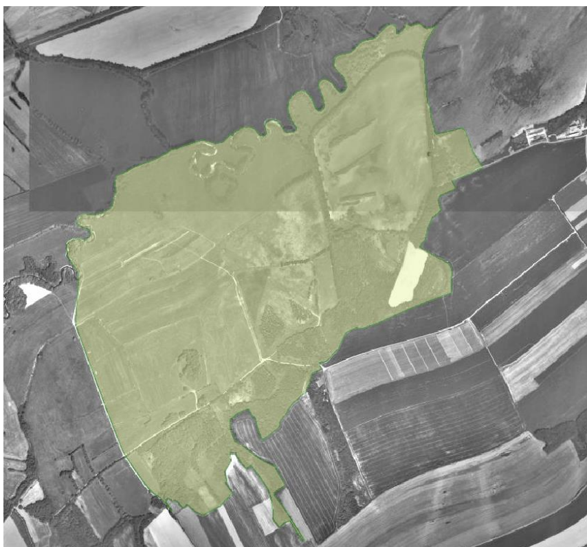
Letecká ortofotomapa 1998–2001.