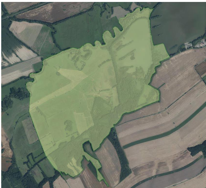
Letecká ortofotomapa 2015.