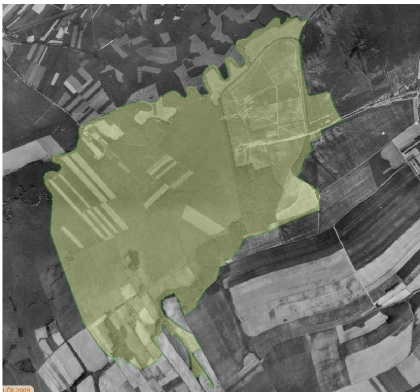
Letecká ortofotomapa z r. 1949–1956.