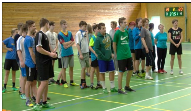
Foto 3 Fotbalový maraton (starší žáci)