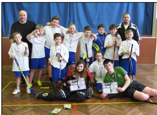
Foto 8 Družstvo florbalu