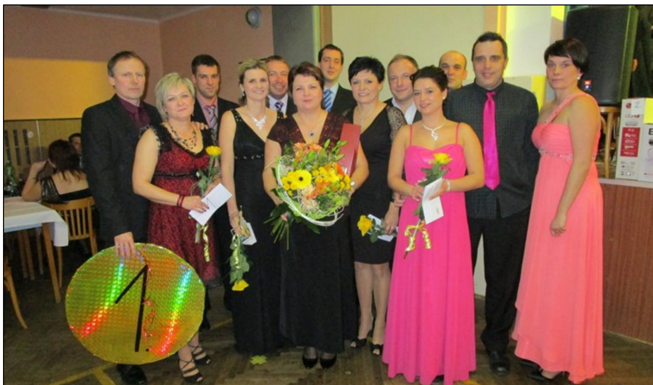
Foto 1 Vítězné sportovního páru roku 2015 (z vyhlášení na Obecním plese, 18. 1. 2016)