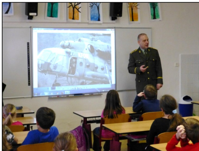
Foto 7 Z návštěvy prvního zástupce náčelníka GŠ AČR

Dověděli se například, jak vypadá pracovní den pana generála, kde studoval, jak si udržuje fyzickou kondici nebo jak se cítil, když poprvé nastoupil na vojenskou školu. V průběhu besedy několikrát z úst pana generála zaznělo, že armáda není k tomu, aby útočila a zabijela, ale je určena výhradně k obraně státu. Zdůrazněno také několikrát bylo to, že by žáci k sobě měli být přátelští a navzájem si pomáhat. Na závěr téměř hodinové besedy jsem převzal z rukou pana generála pamětní plaketu Generálního štábu AČR, pamětní minci a knihu.