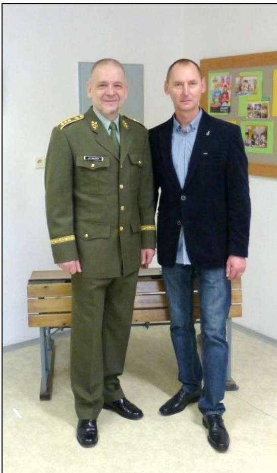
Foto 6 Z návštěvy prvního zástupce náčelníka GŠ AČR